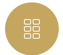
Medium Geschenkdoos 6 visuals